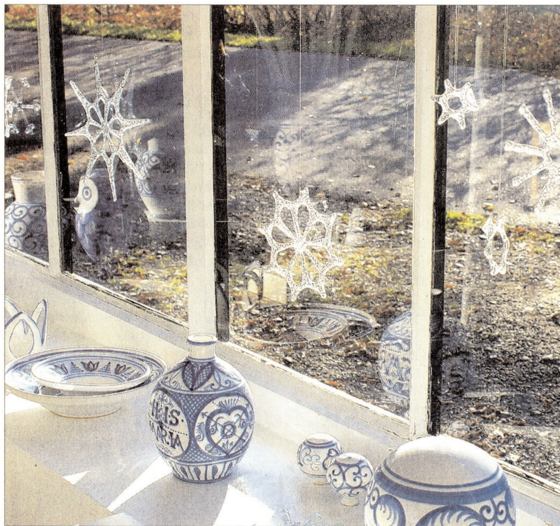
Der Pavillon am See erstrahlt in festlichem Glanz. Kunst und Handwerkliches aus den Werkstätten und Ateliers der Mitglieder der Arbeitsgemeinschaft Dießener Kunst stimmen dort ab Samstag auf die Adventszeit ein.